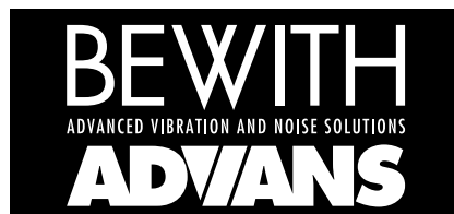
BEWITH ADVANS プロジェクトロゴマーク