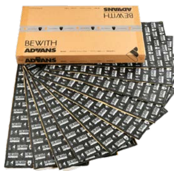
アドバンス調音シート「AD-6CS」 (静音型厚口タイプ、1箱10枚入)