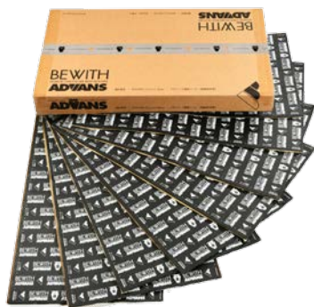
アドバンス調音シート「AD-8CS」 (超静音特厚タイプ、1箱8枚入)

※表記の寸法および質量は設計値です。材質および製造上の理由により、実際と多少異なることがあります。